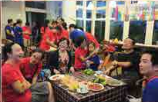
各地校友会活动花絮